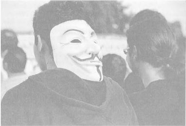
Διαδήλωση στο κέντρο της Αθήνας

Το πνεύμα του σύντομα απλώθηκε σε όλο τον κόσμο και επηρέασε σημαντικά μεγάλους αναρχικούς στοχαστές.