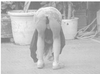
Οι επιπτώσεις ενός παράλογου κοινωνικού συστήματος

αμερικανικό τρόπο ζωής πέρασαν, γιατί δημιουργούν θέσεις εργασίας. Για να γίνει καλά ένας ναρκομανής πληρώνονται τουλάχιστον δέκα οικογένειες. Αν κοιτάξουμε τους κρατικούς φορείς που ασχολούνται με τα ναρκωτικά θα διαπιστώσουμε τουλάχιστον εκατό μονάδες απεξάρτησης με διάφορα ονόματα: ΟΚΑΝΑ-ΙΘΑΚΗ-ΠΑΡΕΜΒΑΣΗ-ΕΞΟΔΟΣ και ένα σωρό άλλες ιδιωτικές κλινικές αποτοξίνωσης. Όλες αυτές ψωμιζούν εκατοντάδες οικογένειες. Έτσι λοιπόν χτυπιέται και η ανεργία με τον θάνατο του διπλανού μας. Οι οργανώσεις αυτές έχουν πάρει τα ωραιότερα νεοκλασικά σπίτια που θα παρέμεναν ακατοίκητα και τα ανακαίνισαν με έξοδα του δημοσίου που απαριθμούνται σε δεκάδες εκατομμύρια ευρώ. Επίσης πήραν και το κέντρο βοθηιών του Ερυθρού Σταυρού στην Ομόνοια που έβρισκε ανακούφιση η φτωχολογιά του κέντρου. Για αυτό το λόγο και δεκάδες άλλους που δεν είναι του παρόντος να απαριθμήσω, το σύστημα δεν μπορεί και δεν θέλει να χτυπήσει τα ναρκωτικά γιατί είναι μέρος συστατικό του τρόπου ζω-