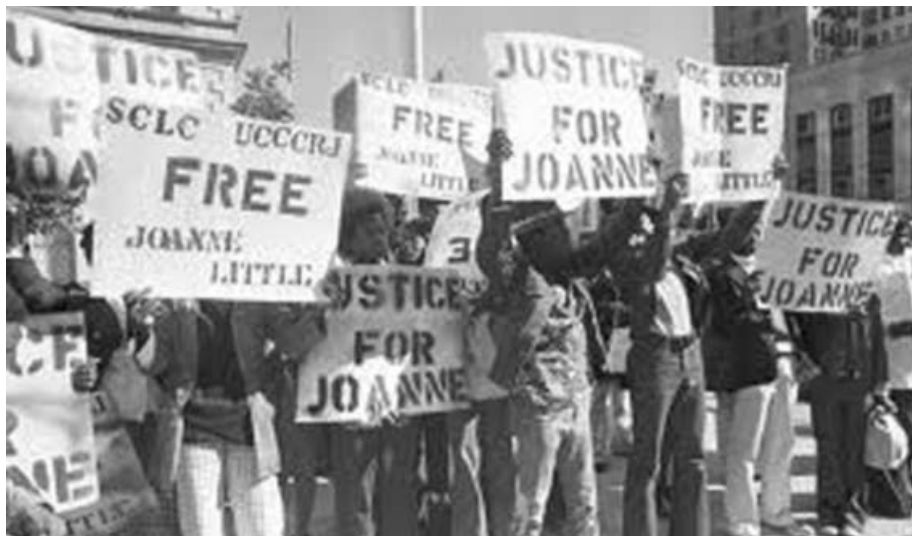
Συγκέντρωση υπεράσπισης της Τζόαν Λιτλ.